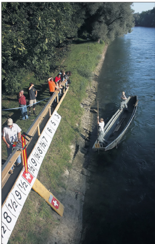
PRÄZISION Die Besten führten die Uferlandung genau am Schweizer Kreuz aus.