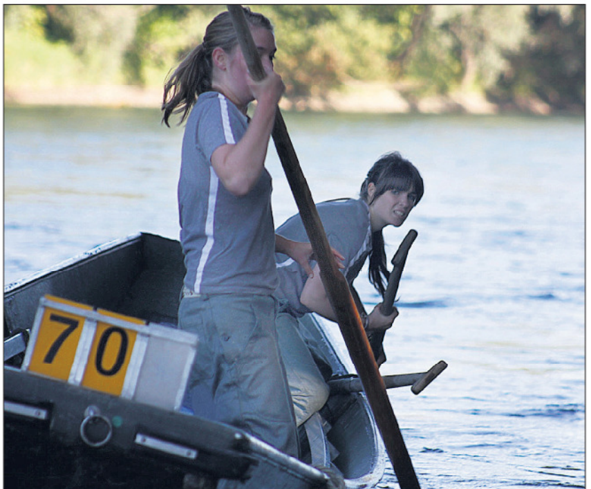
NICHT NUR MÄNNERSACHE Nebst rund 470 Buben und jungen Männern starteten auch 40 Mädchen und junge Frauen.