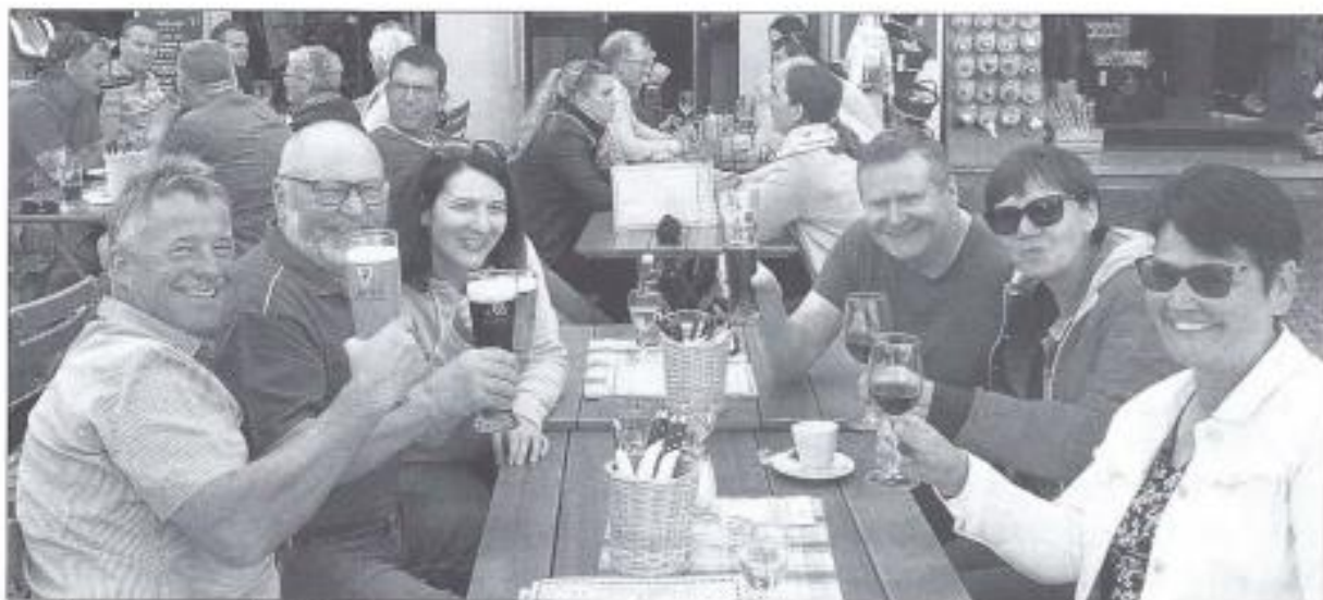
Mittagessen im Restaurant Ganter Brauereiausschank

worauf sie sich ins Markt-, Shopping-, oder Apéro-Vergnügen stürzten konnte.