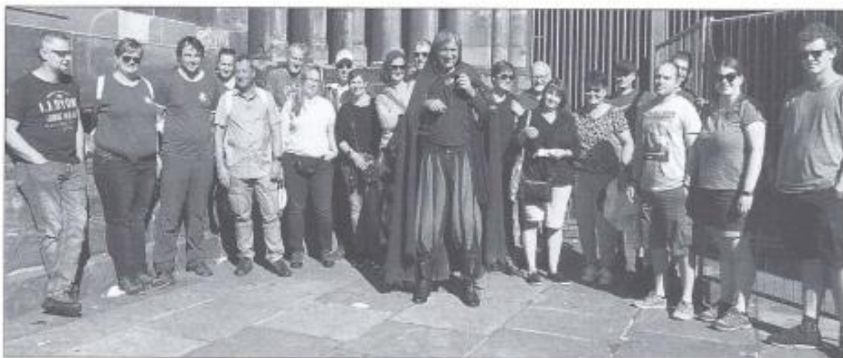
Stadtführung Gruppe «Henker, Huren, Lasterleben»