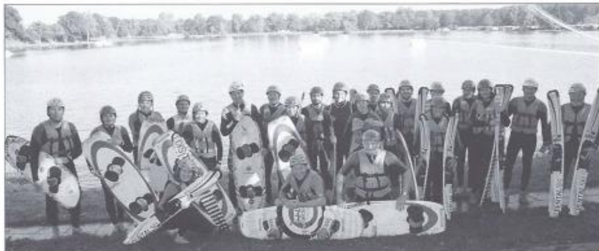
Gruppe der Wassersportbegeisterten

Angefangen mit dem Bezug des Mietmaterials und einer Einführung, konnte dann auch mit dem feuchtfröhlichen Spass gestartet werden, so dass alle 28 Wassersportbegeisterten sich so richtig austoben konnten. Auch das Wetter zeigte sich von der besten Seite, verwöhnte uns mit der wärmenden Herbstsonne und schenkte uns einen prächtigen Spätsommertag. In der Zwischenzeit setzte der Car die restliche Truppe in Freiburg ab,